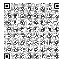
道教委 教育長メッセージ

令和6年3月に新たな「アクション・プラン（第3期）」が策定され、本校におきましてもこの方針に基づき、学校における働き方改革の推進を目指してまいります。引き続き、御理解・御協力をお願いします。